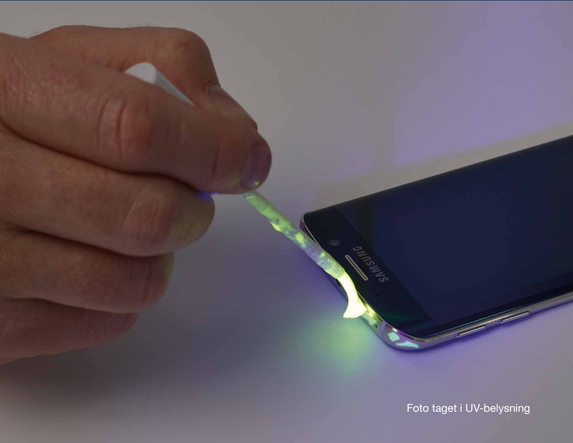
Foto taget i UV-belysning

VIKTIGT - Läs instruktionerna innan du använder SmartWater®